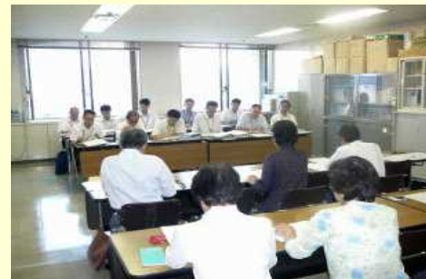
教職員の願いを実現するよう 教育委員会に要請