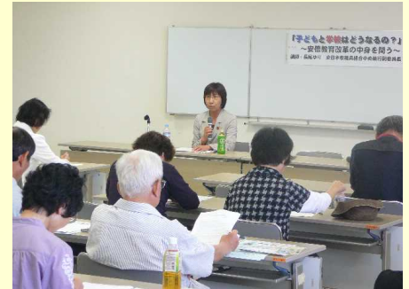
教育講演会を実施