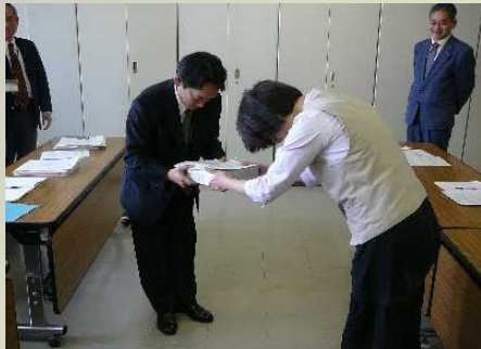
少人数学級実現などを要望する署名を集めて提出