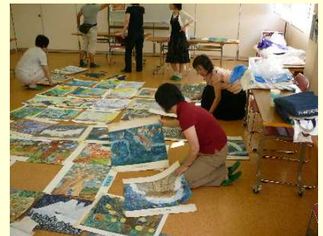
教育実践講座「絵の描き方」