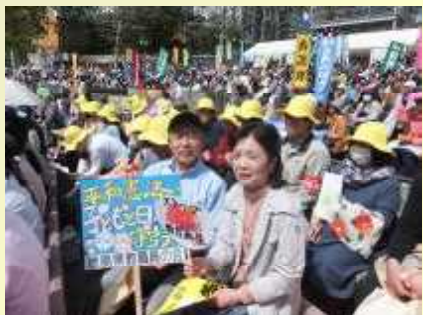
子どもたちと教育を守る活動に参加